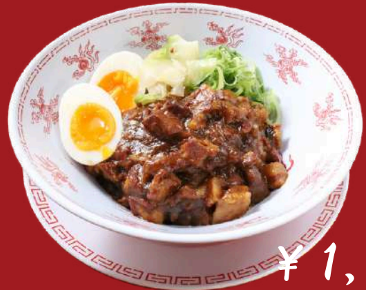
Minced pork rice