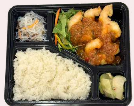
Shrimp in chili sauce