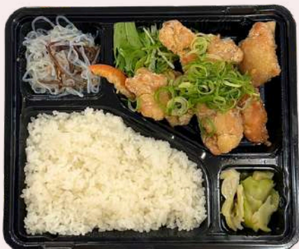
Chinese-style fried chicken