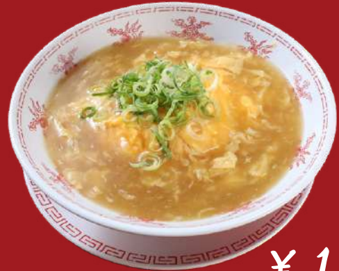
Omelette on Rice